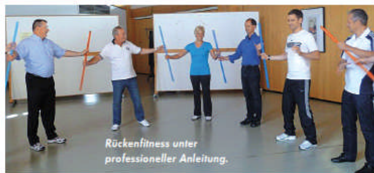
Rückenfitness unter professioneller Anleitung.