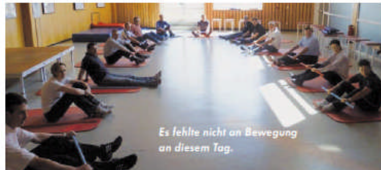
Es fehlte nicht an Bewegung an diesem Tag.

Klar ist, durch betriebliches Gesundheitsmanagement in unseren Betrieben sollen und können wir Gesundheit und Wohlbefinden der Mitarbeiter/Innen langfristig fördern und dadurch Leistungsfähigkeit und Motivation steigern. In diesem Sinne muss unser BGM als eine moderne Unternehmensstrategie verstanden und gelebt werden. In diesem Sinne sollen gerade auch Führungskräfte in Vorbildfunktion auf die eigene Gesundheit besser achten – und langfristig als Gesundheitscoaches ihrer Mitarbeiter wirken. Nach dieser thematischen Einführung ging der Workshop noch weiter, und die Teilnehmer wurden nun auch praktisch an konkrete, selbst erlebbare Gesundheitsaspekte herangeführt. Dabei erhielten die versammelten Geschäftsführer und Koordinationsleiter/innen Informationen und Tipps aus erster Hand, unter anderem zu gesunder Ernährung, Rückengesundheit, eine Schnupperstunde Tai Chi sowie Rückenfitness für den Alltag unter Anleitung eines diplomierten Sportlehrers. Fazit am Ende des Tages: Eine gelungene, informative und anspornende Veranstaltung!