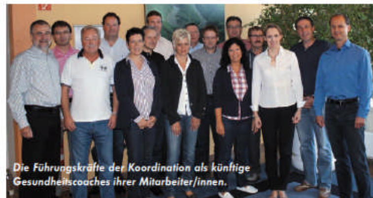
Die Führungskräfte der Koordination als künftige Gesundheitscoaches ihrer Mitarbeiter/innen.