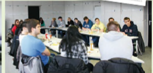
Gespannte Aufmerksamkeit bei 21 Auszubildenden der Koordination Völklingen. Da kam der eine oder die andere sicher ins Nachdenken...